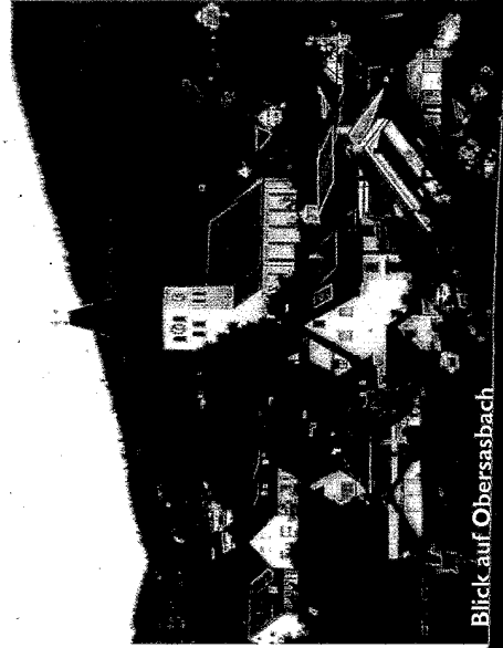
Blick auf Obersasbach

Zum Abschluss treffen sich alle Wanderer wieder gegen 15:00 Uhr in der Grindehalle in Obersasbach zum gemütlichen Ausklang des Tages.